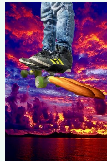
So wünschen sich die Kinder die Fortbewegung in der Zukunft.