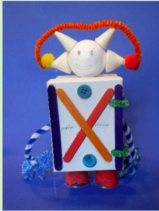
Roboter zum Beschützen und als Mathe-Hausaufgabenhilfe

In drei künstlerischen Werkstätten haben sich 8- bis 12-jährige Kinder Gedanken über ihr Leben in 20, 30 Jahren in Köln gemacht und die Ideen dann in Skulpturen, verschiedenen Bauwerken, einem Stop-Motion-Trickfilm und Fotocollagen umgesetzt. Alle Kunstwerke wurden in einer Erlebnis-Ausstellung im Mai gezeigt. Das Konzept für die interaktive Ausstellung wurde von Ulrich Baer entwickelt und realisiert.