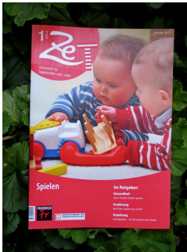
Zeitschrift für Tagesmütter und -väter Friedrich-Verlag, Seelze